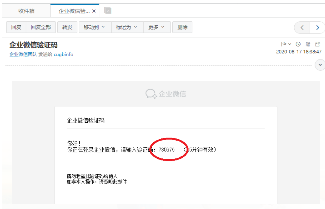
图 9 邮箱中的验证码

最后在图 10 的“填写验证码”一栏输入你的邮件中的验证码，点击“验证”，完成身份验证。