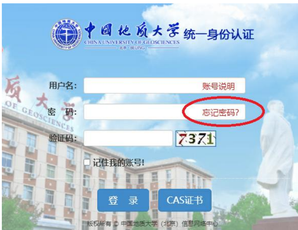
图 1 信息门户登录