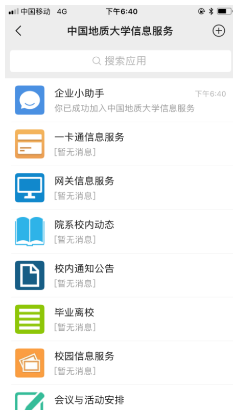
图 11 关注成功