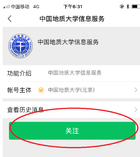
图 4 在手机上点击“关注”按钮