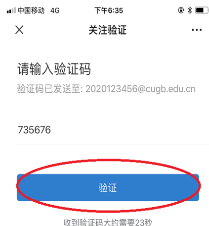
图 10 验证码提交

点击“关闭”，返回企业小助手，点击“返回”，进入微信企业号主界面，如图 11 所示。