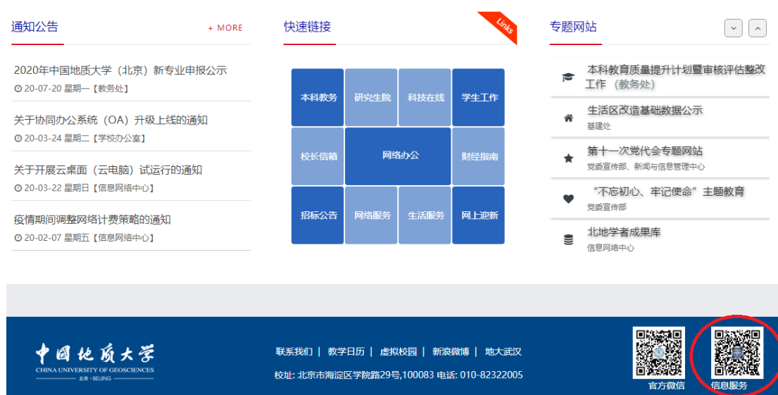
图 3 手机扫描二维码关注企业号

在手机上登录微信，扫描学校主页（www.cugb.edu.cn）下方“信息服务”二维码，点击“关注”，进入企业号。