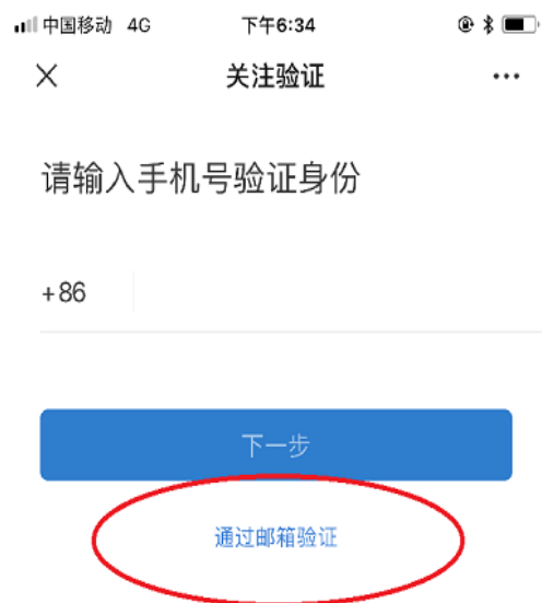
图 6 点击“通过邮箱认证”