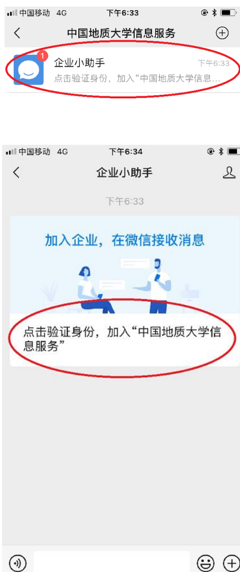
图 5 点击“企业小助手”

请选择“通过邮箱认证”，输入本人学校邮箱名称，格式为“学号/工号@cugb.edu.cn”，例如：学号为“2020123456”，则在邮箱地址一栏输入“2020123456@cugb.edu.cn”，然后点击“下一步”，其验证码发到你的邮箱，需要从邮箱中获取。